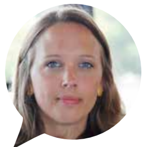
Etatdirektorin WEFRA WERBEAGENTUR

nach dem nächsten Schritt auf der Karriereleiter stehen da ebenso im Zentrum wie die jeweiligen individuellen Herausforderungen, denen sich junge Führungskräfte gegenüber sehen. “ Hier seien die Coachings, die im Rahmen der regelmäßigen Treffen angeboten werden, essentiell. „ Wir profitieren gegenseitig von unseren Erfahrungen und das nicht nur auf der inhaltlichen Ebene, sondern vor allem bei der persönlichen Entwicklung. “