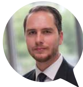
Head of Healthcare Management ARVATO HEALTHCARE

Bei Young Excellence in Healthcare geht es nicht nur ums Netzwerken, warum Young Potentials YE(H)S sagen sollten, erklären die Mitglieder: