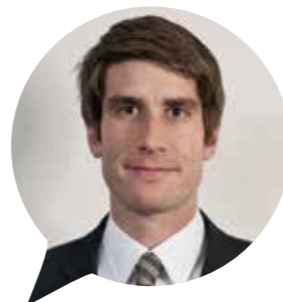
Strategy Adviser SUNSTAR

einen ganz klaren gesellschaftlichen Handlungsauftrag, der sich durch die Ideen und das Engagement der Treiber aus dem Healthcare-Markt realisieren lässt. Verwirklichen ließen sich solche Ideen schließlich durch die gebündelte Kompetenz junger Entscheidungsträger, die sich bei YEH zusammenfinden und konzentriert Dinge vorantreiben. „ Der gemeinsame Austausch steht für mich im Vordergrund. Durch diese wertvollen Verbindungen können Bewegungen entstehen, die auch der Branche gut tun werden. “