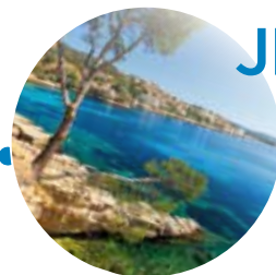
Mallorca Herbst 2014