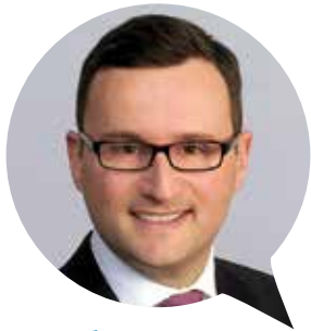
Counsel C'M/S' Hasche Sigle