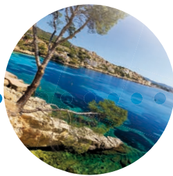
Mallorca Herbst 2014