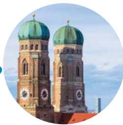
München Frühjahr 2015